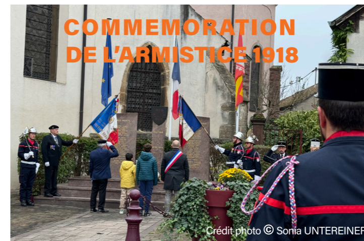
COMMEMORATION DE L'ARMISTICE 1918