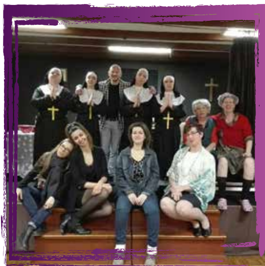
La troupe « du ptit bazar » Troupe d'adultes Metteur en scène : Viviane