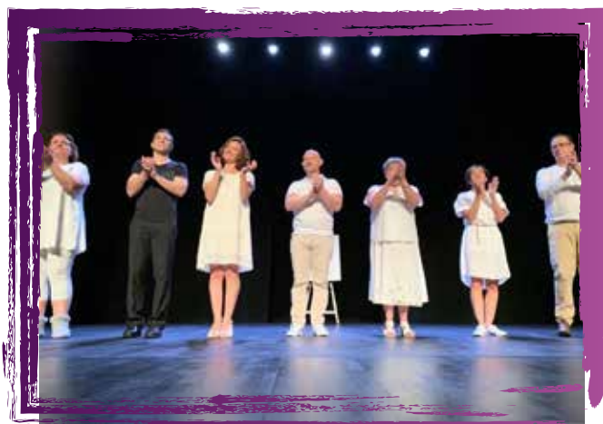
la compagnie « du court-circuit » Troupes d'adultes Metteur en scène : Laurent

La Troupe Théâtrale de Herrlisheim est à la recherche de sa costumière . Elle aura la responsabilité des costumes et accessoires de la troupe et devra avoir des connaissances en couture pour les retouches. Merci de nous contacter au 06 87 50 16 92