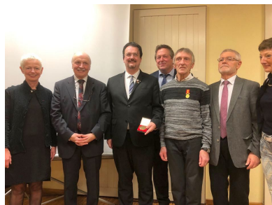
Vœux du Maire