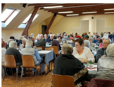
Repas des aînés