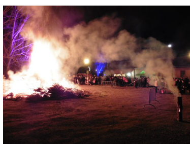
Crémation des sapins