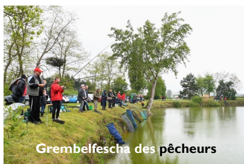
Grembelfescha des pêcheurs