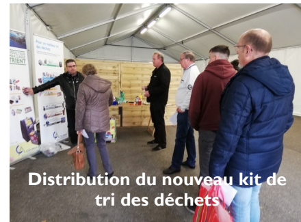
Distribution du nouveau kit de tri des déchets