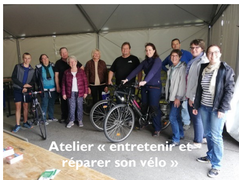
Atelier « entretenir et réparer son vélo »