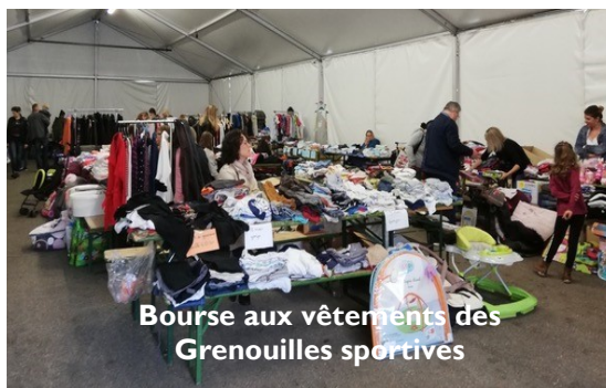
Bourse aux vêtements des Grenouilles sportives