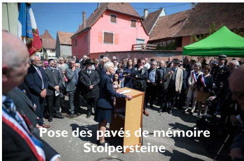
Pose des pavés de mémoire Stolpersteine