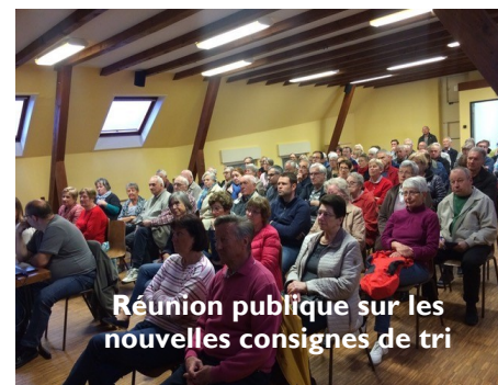
Réunion publique sur les nouvelles consignes de tri