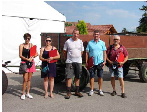
Jury du fleurissement