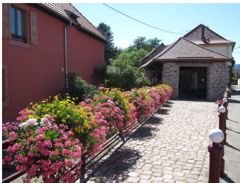
Fleurissement au lavoir