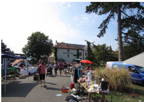
Marché aux puces