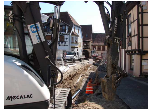
Travaux Place de l'Eglise