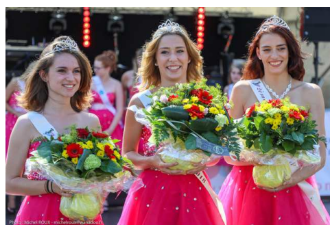
Miss Grenouille 2018