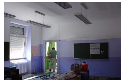
Salle de classe repeinte