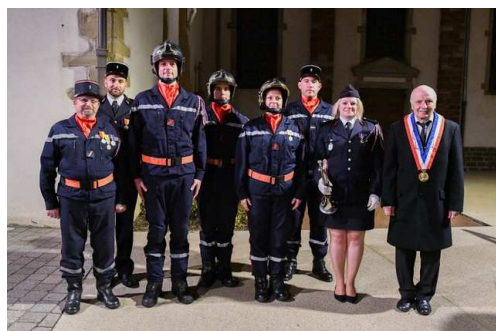
Récipiendaires lors de la Sainte-Barbe des sapeurs-pompiers