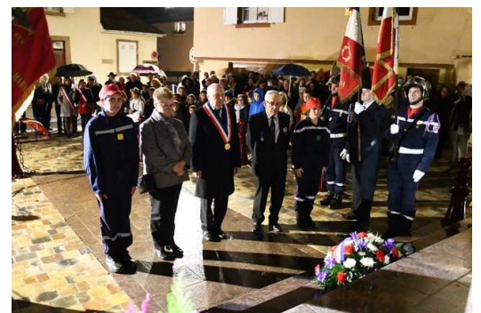
100 ème anniversaire de la Commémoration de l'Armistice