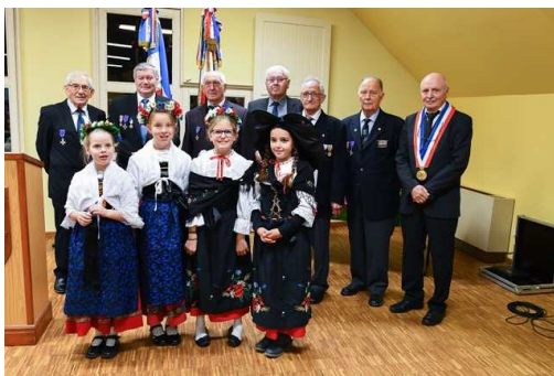
Les médaillés de l'UNC

Réparation de la toiture du clocher suite aux intempéries