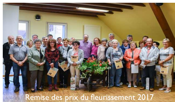
Remise des prix du fleurissement 2017