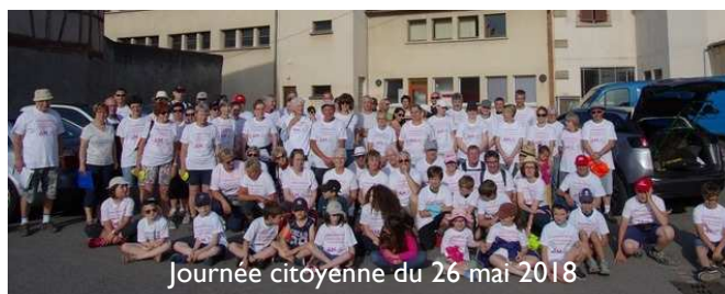
Journée citoyenne du 26 mai 2018