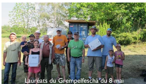
Lauréats du Grepelfeschà du 8 mai