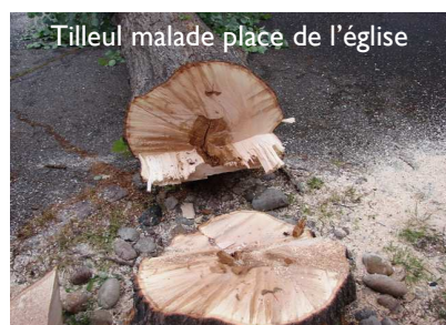
Tilleul malade place de l'église