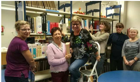
Réorganisation des rayonnages de la bibliothèque par les bénévoles