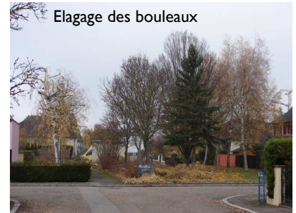
Elagage des bouleaux