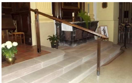
Installation d'une main courante pour accéder à l'autel de l'église