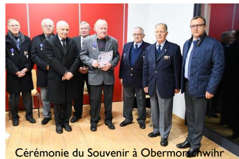
Cérémonie du Souvenir à Obermorschwihr