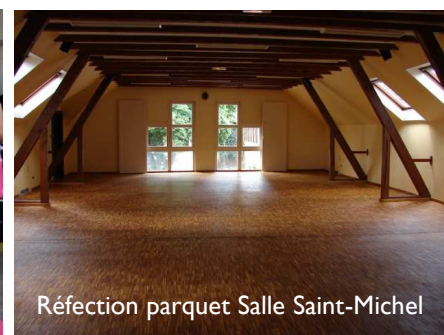
Réfection parquet Salle Saint-Michel