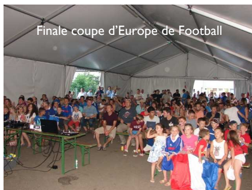
Finale coupe d'Europe de Football