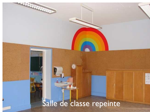
Salle de classe repeinte