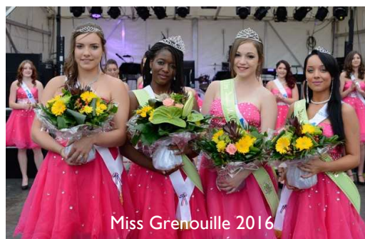
Miss Grenouille 2016