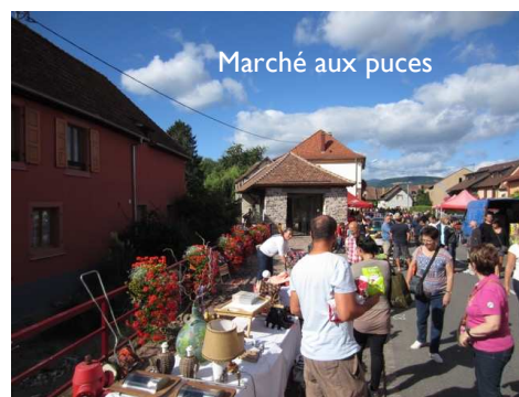
Marché aux puces