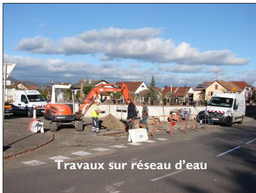
Travaux sur réseau d'eau