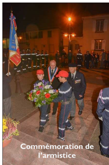
Commémoration de l'armistice