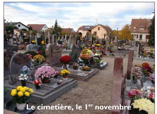
Le cimetière, le 1 er novembre