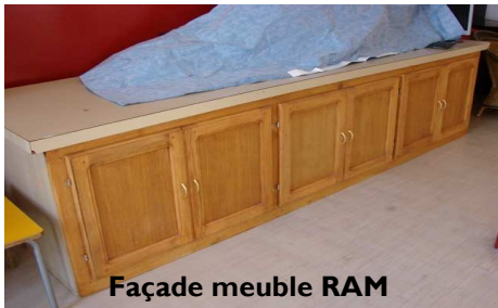
Façade meuble RAM