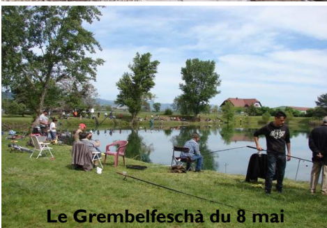
Le Grembelfeschà du 8 mai