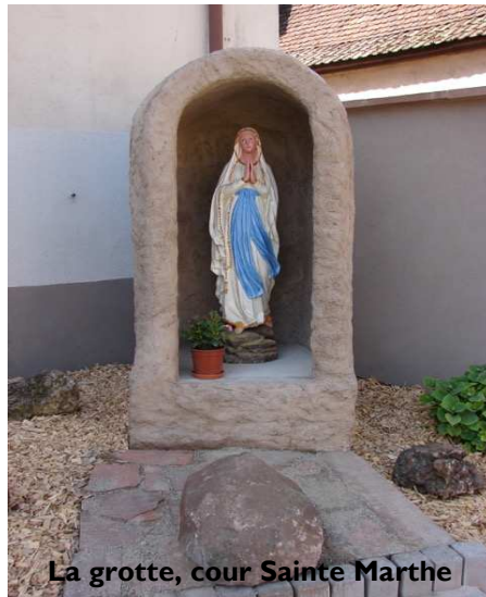
La grotte, cour Sainte Marthe