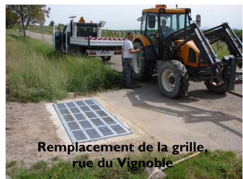
Remplacement de la grille, rue du Vignoble