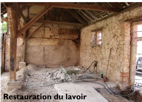
Restauration du lavoir