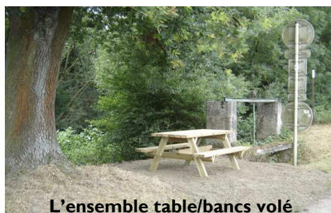
L'ensemble table/bancs volé