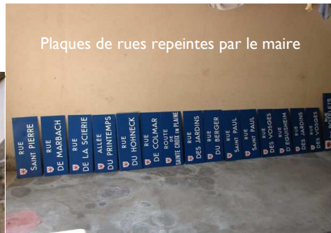
Plaques de rues repeintes par le maire