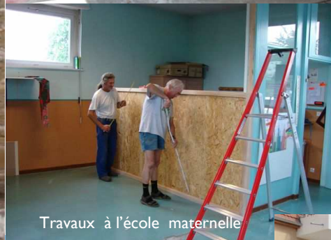
Travaux à l'école maternelle