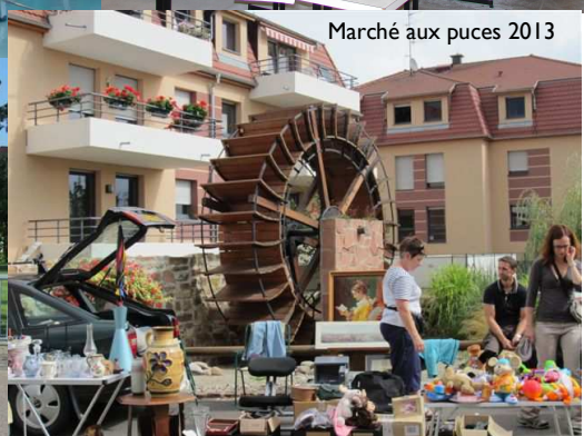
Marché aux puces 2013