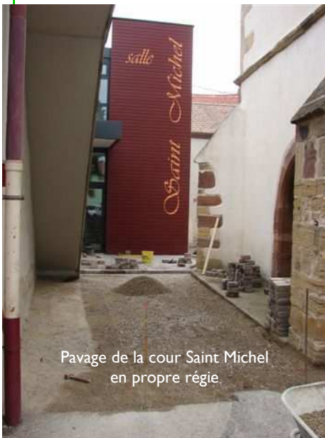
Pavage de la cour Saint Michel en propre régie