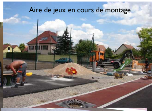
Aire de jeux en cours de montage