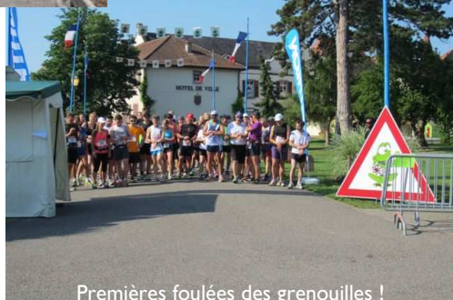
Premières foulées des grenouilles !