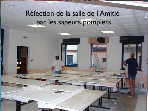
Réfection de la salle de l'Amitié par les sapeurs pompiers