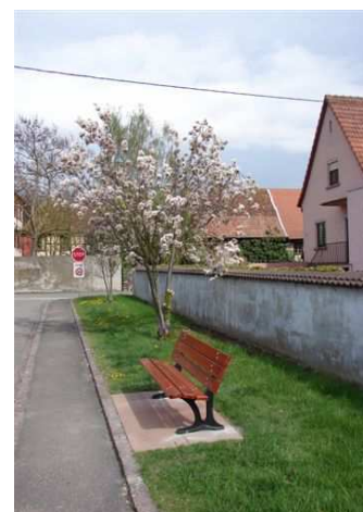
Installation d'un nouveau banc